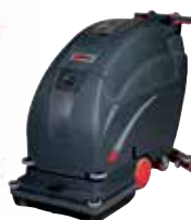
FANG 24T / 26T / 28T