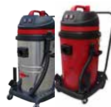
LSU 255-255P LSU 275-275P